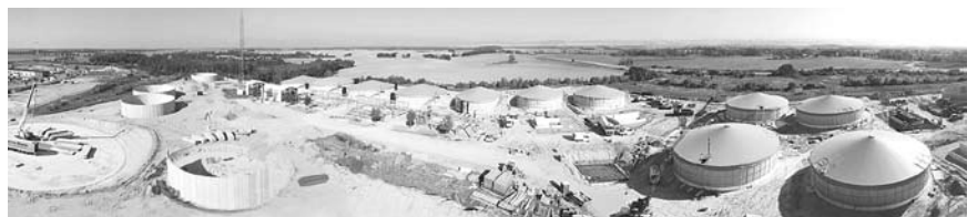
Panoramatický pohled na staveniště bioplynového parku