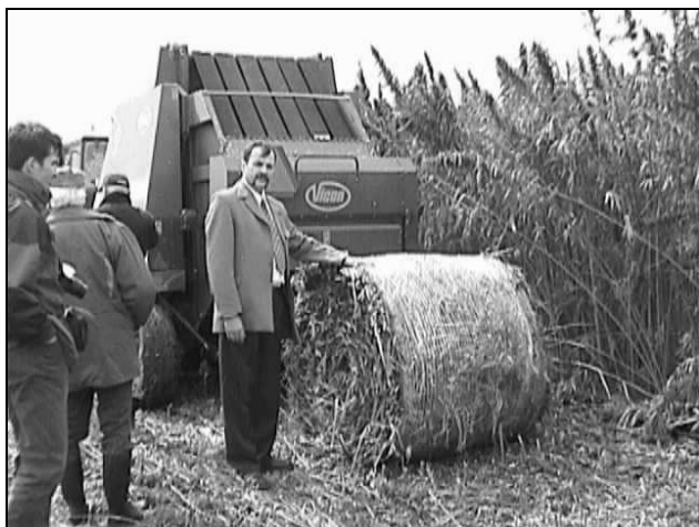
Foto 3. Sběr konopí válcovým lisem

Travní sekačka VICON ukládala do řádku celé rostliny, žací řezačka Agro krátila rostliny na cca 52 cm dlouhé kusky a ukládala je rovněž do řádku. SMU 2 ze SRN demostroval v praxi plošně ukládané sečení po patrech tím, že na předku traktoru byla výškově stavitelná lišta s protiběžnými kosami a vzadu měl traktor namontovanou obyčejnou travní lištu. Z videozáznamu bylo předvedeno osazení traktoru celkem čtyřmi lištami, což se jeví jako optimální pro jakoukoliv délku stonku. Další předností tohoto řešení je skutečnost, že se nejedná o speciální jednoúčelový stroj, ale o snadno namontovatelné přídatné prvky. Poslední a nezanedbatelnou předností je skutečnost, že i česká firma má ve svém výrobním programu výrobu travních lišt s protiběžnými kosami, dokonce v zesíleném provedení,