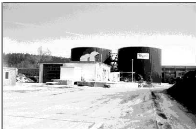
Foto 1: Pohled na bioplynovou stanici v Teugnu u Regensburgu, SRN

Je to nejstarší bioplynová stanice v ČR, uvedena do provozu v roce 1974. Bioplynová stanice zpracovává kromě kalů z komunální ČOV a organických odpadů, 120 m 3 kejdy denně.