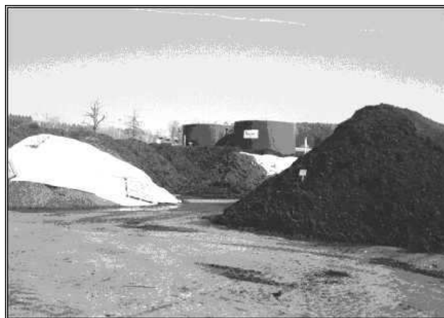
Foto 2: Pohled na bioplynovou stanici kombinovanou s kompostárnou

Hlavní výhody anaerobního zpracování organických odpadů jsou: