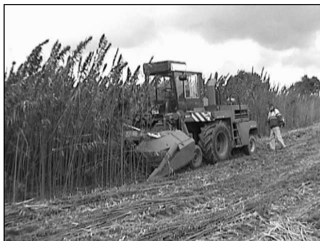
Foto 2. Sklizeň konopí - žací řezačka Agro