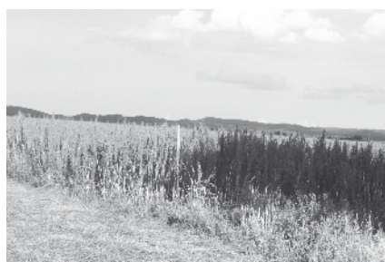
Krmný šťovík před sklizní začátkem července, určený pro vytápění

Dosud se u nás krmný šťovík osvědčil pro přímé spalování. Během devítiletého období jeho pěstování bylo zjištěno, že je nutné zvýšit výsev na 8–10 kg/ha, nebo doporučit i podzimní setí. Zimní vlaha je pak zárukou jarního úspěšného vzejití osiva. Nezbytné je i provzdušnění půdy, nejlépe lehkým diskováním. To pěstitelé bohužel mnohdy neprovádí, pak porost degraduje a poskytuje nízký výnos. Krmný šťovík není plevel, ale řádná plodina, vyžadující správné ošetřování, což je podmínkou jeho úspěšného pěstování. Tam, kde má řádné podmínky pro vegetaci, jsou výnosy kolem 9–10 t/ha suché biomasy (viz foto).