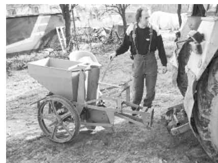
Úprava sázecíky brambor pro výsadbu Miscanthu

Osázení jednoho hektaru Miscanthem trvá asi půl dne při ceně do 5000 Kč. Dal-